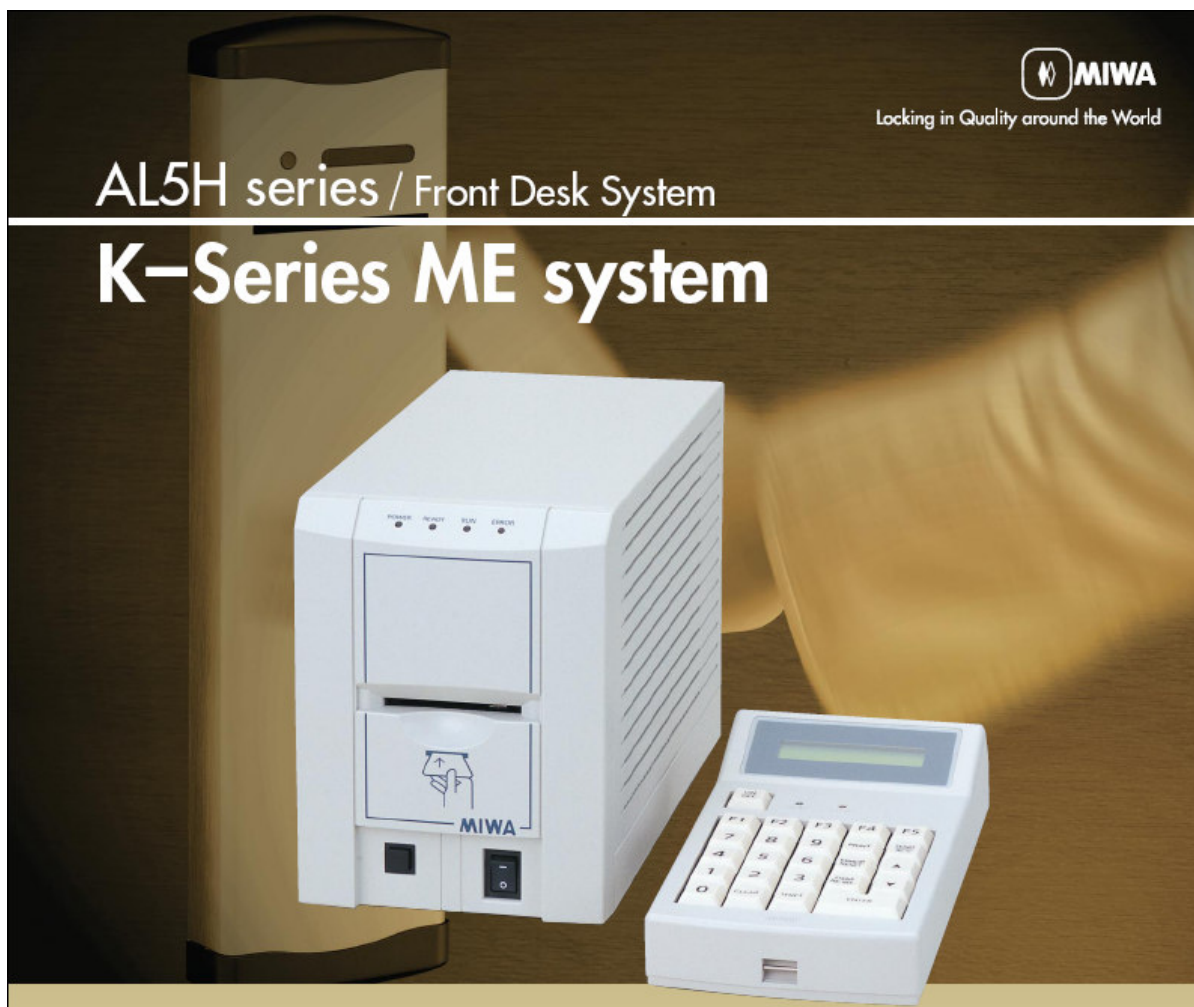
Przykładowa konfiguracja urządzeń (wersja KME)

KME-N – wersja kilkustanowiskowa (max. 10 kodery z możliwością podłączenia do systemu recepcyjnego PMS)