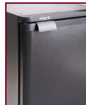
Porta pannellabile Interchangeable door panel