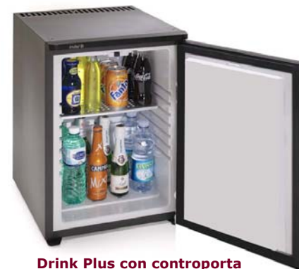
Drink Plus con controporta piatta

The standard supplied dark grey door panel can be changed with a very diverse range of colour panels