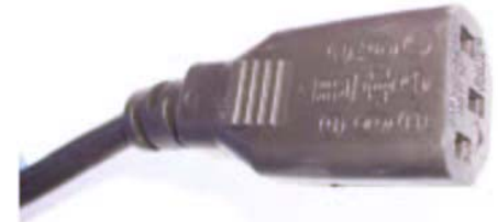
Cavo alimentazione Cord

I minibar non verranno più forniti completi di cavo alimentazione, ma questi saranno consegnati a parte e dovranno essere connessi alla presa che trovate in ogni minibar (vedi foto). Questa modifica tecnica ci permette di semplificare la gestione dello stock in quanto terremo disponibili a magazzino un'unica versione per ogni modello di minibar. Con ogni spedizione riceverete un collo in più contenente i cavi di alimentazione. Il collo sarà menzionato sia sul documento di trasporto che sulla fattura. Il prezzo dei minibar non cambia.