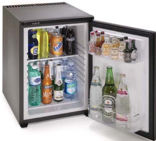
Drink 40 Plus

Drink Plus is a new line of absorption minibars offered by Indel B. A more advanced version of an existing, well known line of absorption minibars. The new Drink Plus line is innovative in terms of both technical features and design.